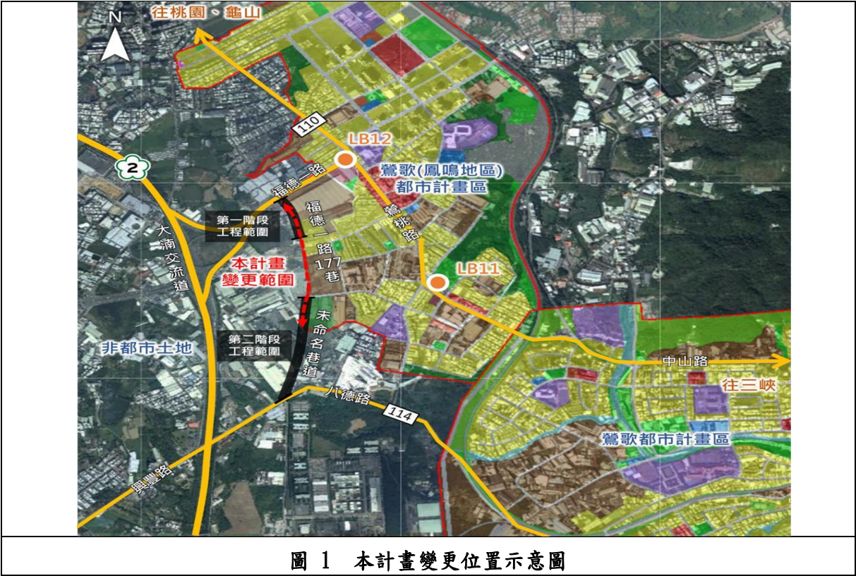
圖 1 本計畫變更位置示意圖