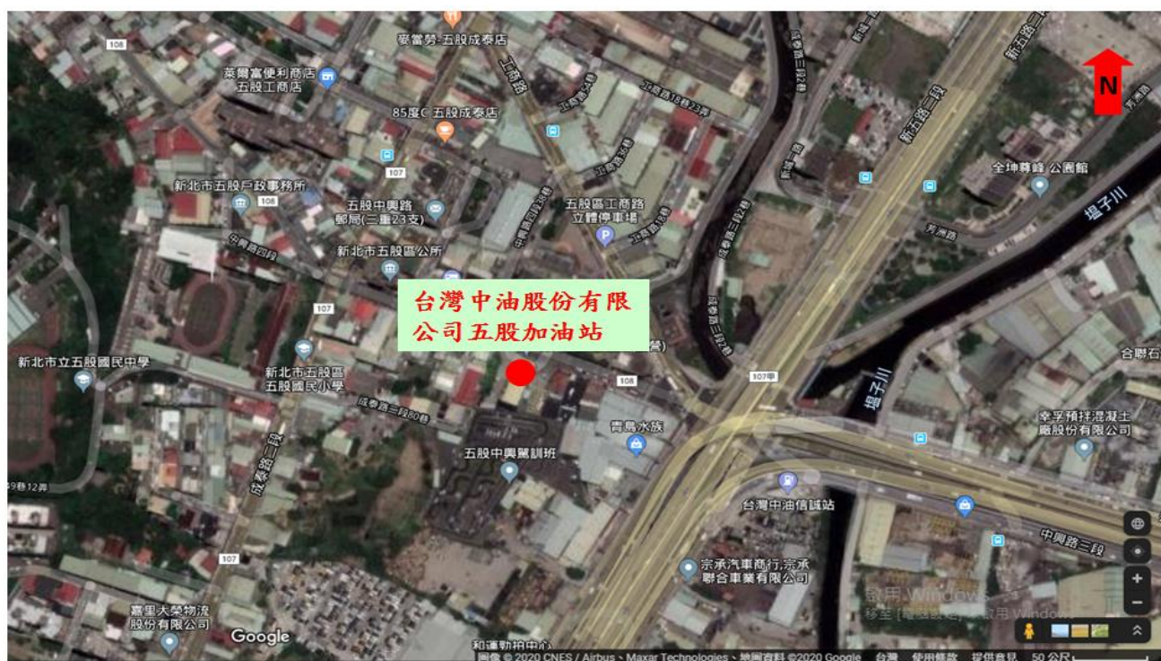
台灣中油股份有限公司五股加油站位置示意圖