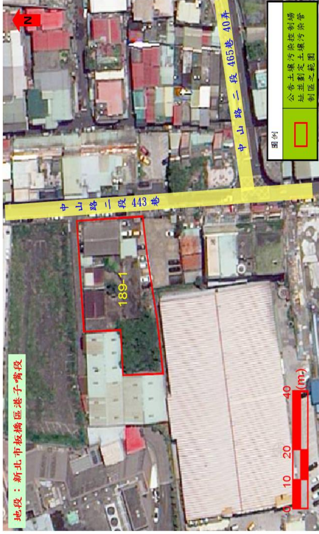
原和興機械廠股份有限公司公告土壤污染控制場址及劃定土壤污染管制區之示意圖