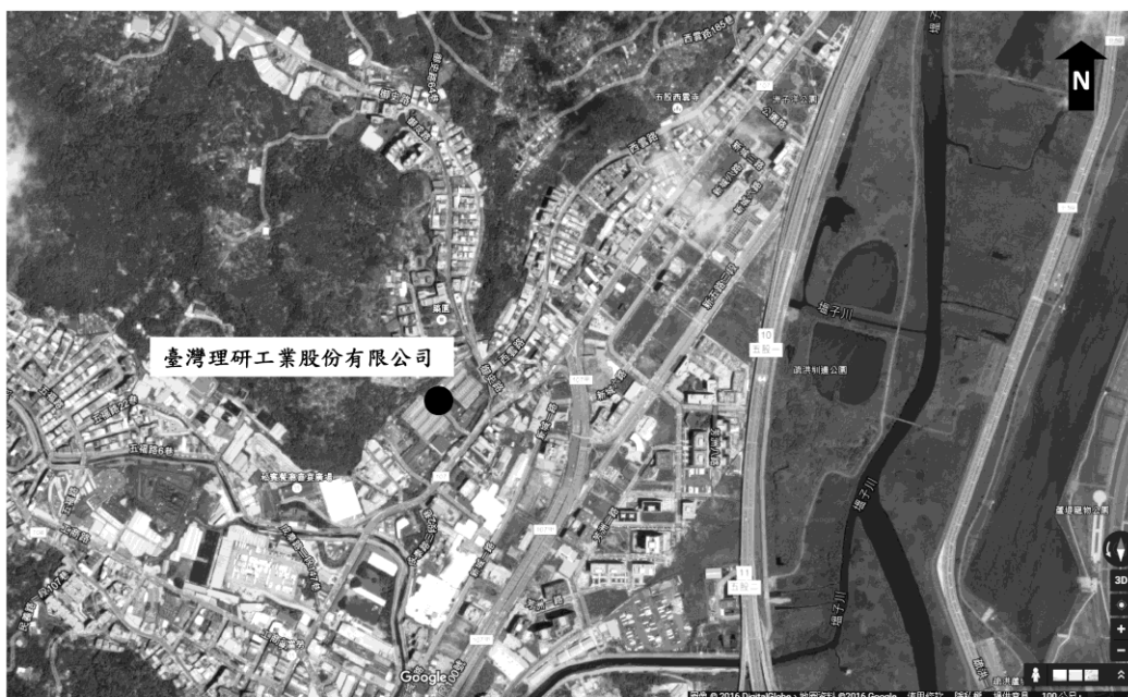
臺灣理研工業股份有限公司公告土壤污染控制場址及劃定土壤污染管制區之示意圖