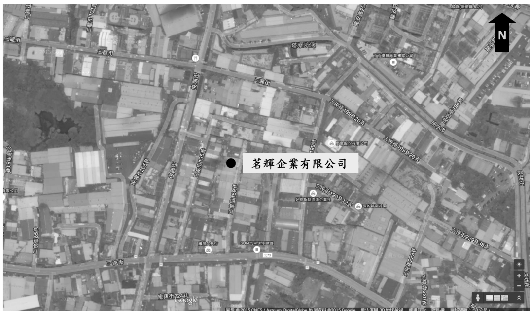
茗輝企業有限公司公告土壤污染控制場址及劃定土壤污染管制區之示意圖