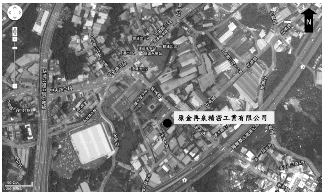
附圖一、原金再泉精密工業有限公司所在土地位置示意圖