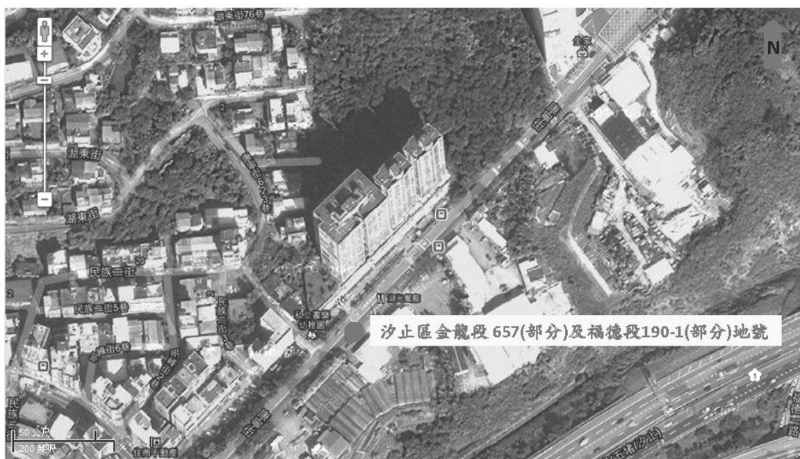
汐止區金龍段657(部分)及福德段190-1(部分)地號公告土壤污染控制場址及劃定土壤污染管制區之地號示意圖

八、如有不服本處分，得於公告之次日起 30 日內，繕具訴願書並檢附本處分，送由新北市政府環境保護局向新北市政府提起訴願。